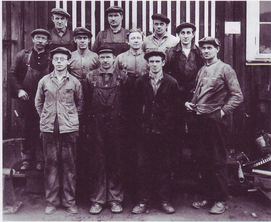
Venstre: Brødboksar og anna kjøkkenutstyr, tørkestativ, sparkstøttingar – kanskje også ein og annan bærplukkar? Arbeidarane hausta fordelar av ein sterk fagorganisasjon og ei velvillig fabrikkleiing, mellom anna ved at arbeidarane fekk bruke fabrikk til å lage ting til privat bruk. Foto heimelaga bærplukkar: Norsk skogbruksmuseum. Over: Verkstadgjengen på 1930-talet. Fotograf ukjent. Eigar: Södra Cell Folla.

Samtidig var det ein tilvenningsprosess for kroppsarbeidarar å skulle tenke på å ha det 'fint' omkring seg. Av og til oppsto det irritasjon fordi leinga ikkje