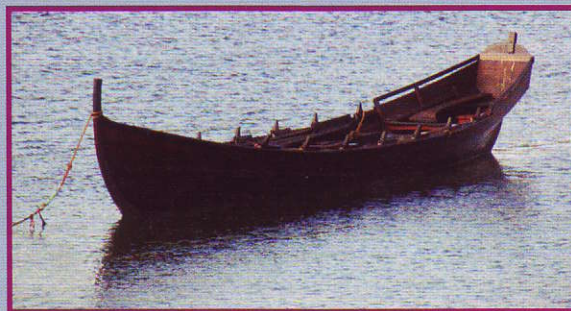
"Kjerkjebåten" Fjordamerra, med akterspegel og sju par årar. Kyrkjebåten er ein variant av geitbåten. I Valsøyfjorden i Halsa kommune er det eit eige museum for geitbåtar, sjå www.nordmore.museum.no . Museet er ein del av Nordmøre museum.

Kulturminnedagane blir arrangerte kvart år over heile Europa, og omfattar 50 land. Det er Europarådet som har innstifta markeringa.